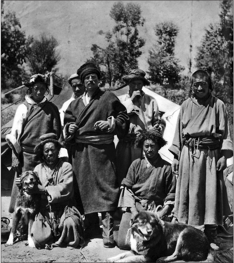
Sven Hedin mit seinen tibetanischen Dienern im Herbst 1908 an der indisch-tibetischen Grenze. Hedin kleidete sich während der Poo-Expedition wie ein Tibeter, um nicht so schnell als Europäer entdeckt zu werden.

Transhimalaya (nach ihm Hedingebirge genannt), die Quellen der Flüsse Brahmaputra, Indus und Sutlej, den See Lop Nor sowie Überreste von Städten, Grabanlagen und der Chinesischen Mauer in den Wüsten des Tarimbeckens. Den Abschluß seines Lebenswerkes bildete die postume Veröffentlichung seines „Central Asia Atlas“.