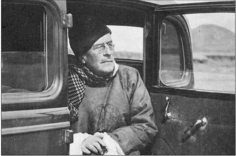
Sven Hedin während seiner vierten Asienexpedition 1927–1935.

Sven Hedin war aber auch ein politischer Mensch und als solcher ein steter Freund Deutschlands.